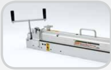
Dụng cụ cắt dây đai Flexco

Laser Belt Square Flexco có thể được sử dụng cùng với nhiều sản phẩm Flexco, bao gồm: