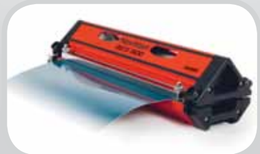
Dụng cụ gia công dây đai Novitool®