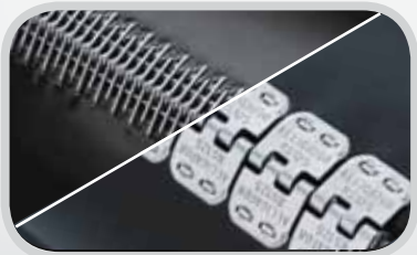
Clamps Clipper® và Hệ thống kẹp dây đai Alligator®