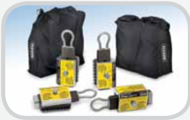
Smart Clamp™ cho Dây đai hạng nhẹ