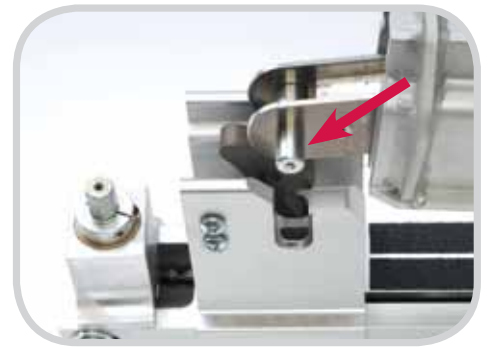
Chỉnh thẳng hàng dầm kẹp theo hướng thẳng đứng

Có thể tháo nhanh dầm kẹp trên bằng cách ấn nhẹ then nhả nhanh. Việc lắp đặt dầm kẹp trên càng dễ dàng hơn – chỉ cần điều chỉnh thẳng hàng dầm kẹp theo hướng thẳng đứng và cho phép dầm rơi vào đúng vị trí. Để thu được áp suất kẹp cuối cùng, chỉ cần quay vài lần hệ thống vít có ren Acme cầm tay để kẹp ăn khớp hoàn toàn.