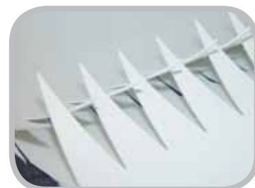
Đột chốt chính xác