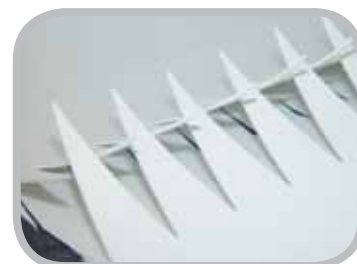
Đột chốt chính xác