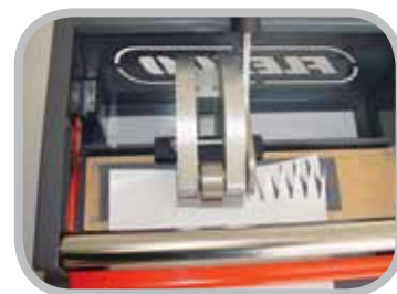
Đột lỗ thủ công - vận hành bằng một tay

* Thích hợp cho cả mỗi nối chốt đột dập.